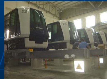
LRT新交通システム(シンガポール)