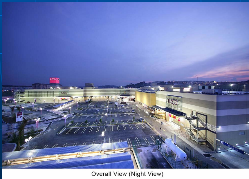
Overall View (Night View)