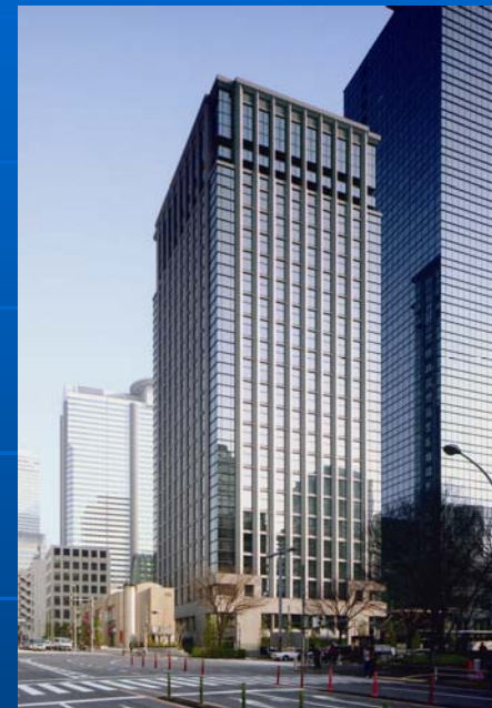
西新宿6丁目再開発