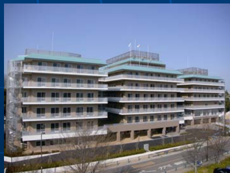
江古田の森 保健福祉施設