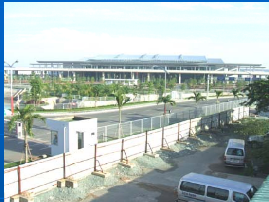
タンソンニャット空港 (ベトナム)